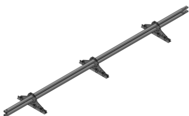
Снегозадержатель для фальцевой кровли Grand Line 3 метра